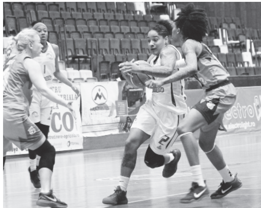
Ezúttal Robinson (2) teljesítménye is csalódást keltett: a Sirius légiója „leküzdötte” magát Lauderdale szintjére, aki a múlt meccsen „történelmi” nulla pontot ért el, és ezúttal sem sokat javult.

Az idény egyik leggyengébb teljesítményét nyújtották a Marosvásárhelyi Sirius női kosárlabdacsapatának tagjai az Aradi ICIM elleni találkozón, a bajnoki középszakasz keretében. Az eredmény ennek megfelelően alakult, noha a vendégek sem csillogtak, például mindkét fél mindössze 1-1 triplát dobott egész mérkőzésen (1).