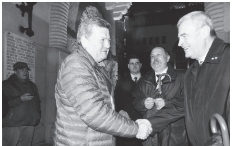
A prefektus megbízottja átveszi a petíciót