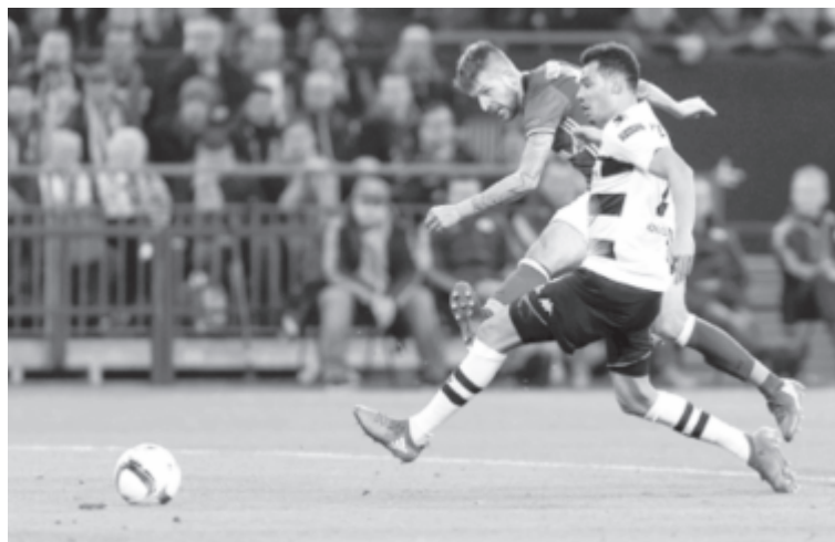
A német rangadón nem bírt egymással a Schalke és a Mönchengladbach.