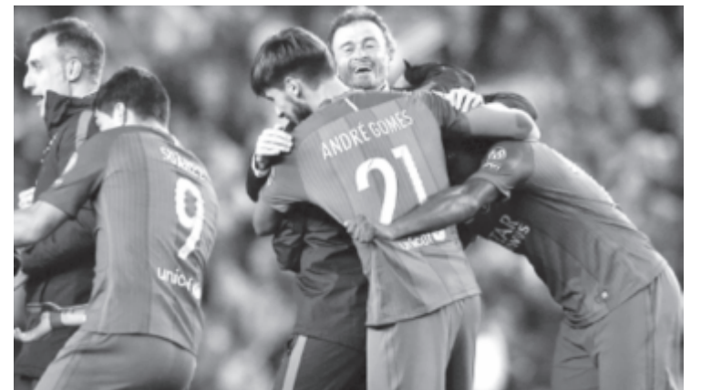
Hatalmas öröm a Barcelona táborában: a PSG elleni sikerével a katalán csapat az első, amely négygólos hátrányból fordít meg egy párharcot.

Németországban villámgyorsan ledolgozta idegenben összeszedett egygólos hátrányát a Borussia: a 4. percben jobboldali szögletet követően Aubameyang fejelte közelről a labdát a Benfica kapujába. Mindkét csapat előtt adódtak lehetőségek, bár a hazaiak többször veszélyeztettek, s végül ennek meg is lett a gyümölcse: a szünet után előbb Pulisic, majd újra Aubameyang volt eredményes. A gaboni támadó ráadásul harmadik találatát is megszerezte, így az első afrikai játékos lett, aki a legrangosabb európai kupasorozat egyenes kieséses szakaszában mesterhármast jegyzett. Négygólos sikerével a Ruhr-vidéki együttes bebiztosította helyét a negyeddöntő mezőnyében, míg a liszaboni alakulat sorozatban hét megnyert tétmérkőzés után kapott ki.