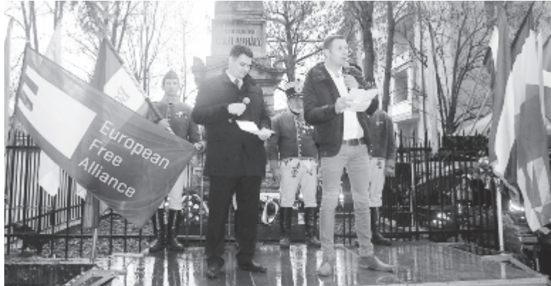
Wouter Patho, az Európai Szabad Szövetség (EFA) alelnöke

A Székely Nemzeti Tanács nevében szóló Szűcs Péter beszédében kiemelte: „Eljött az ideje, hogy megteremtjük az önrendelkezés intézményes kereteit. Ezért emlékezzünk elmúlt korok hőseire, akik nem voltak restek a szabadságért cselekedni, ezért hajtunk fejet a mártírok előtt itt, a marosvásárhelyi vértanúk emlékművénél is, ezért vonulunk autonómiát követelve a kormányhivatal épülete elé, ezért tüntetjük ki megbecsülésünkkel azokat, akik támogatnak ebben a teremtési folyamatban”. Kijelentette, közösségi akarattal hegyeket lehet megmozgatni, és „mi ezeknek a hegyeknek a megmozgatására gyűltünk össze”, mert „csak így lehetünk méltók eleinkhez”.