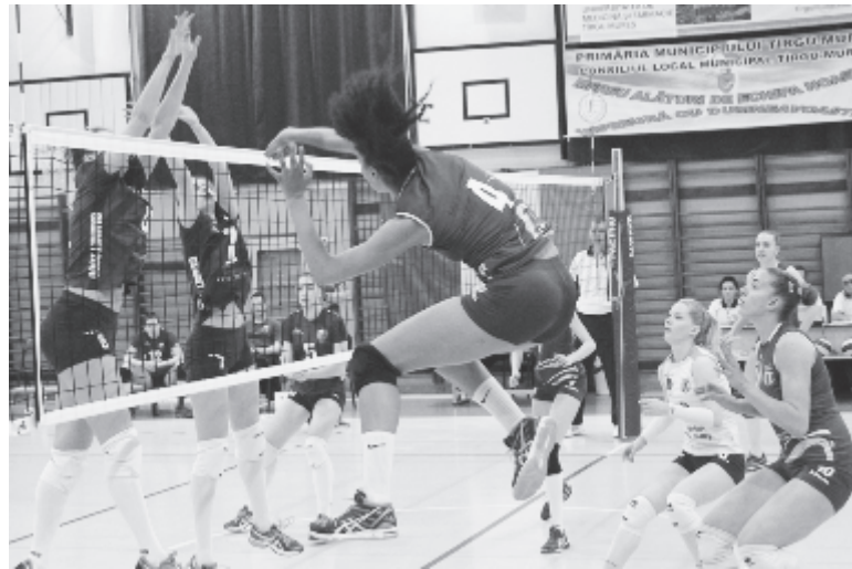
Nem tudta kellőképpen motiválni magát a Lugos elleni bajnoki találkozóra a marosvásárhelyi csapat.

Az első szettben még minden menetrend szerint alakult, a másodikban azonban átengedték a kezdeményezést a gyakorlatilag biztos kieső házigazdáknak. A harmadik játszmatban, úgy tűnt, minden helyerázódik, és a negyedik elején is, amikor 9-1-re húzott el a Medicina. A craiovai csapat azonban 15-re egyenlített, és a szett végén 20:16-ra átvette a vezetést, majd szettlabdája is volt 25:24-nél, amelyet ha megnyer, akkor pontot is rabolt volna a marosvásárhelyi csapattól. A játszmat azonban nyögvenyelősen mégiscsak a Medicina hódította el, amelynek az